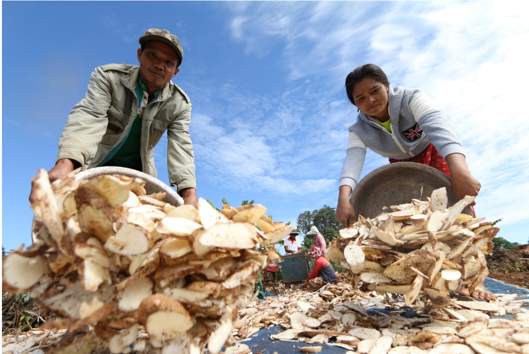
ຊາວກະສິກອນທີ່ໄດ້ຮັບຜົນປະໂຫຍດຈາກໂຄງການ ສິ່ງເສີມການຜະລິດກະສິກໍາ ແລະ ປ່າໄມ້ແບບຍືນຍົງ ພວມເກັບກ່ຽວມັນຕົ້ນສິດງທີ່ຜ່ານໃໝ່ໆ.