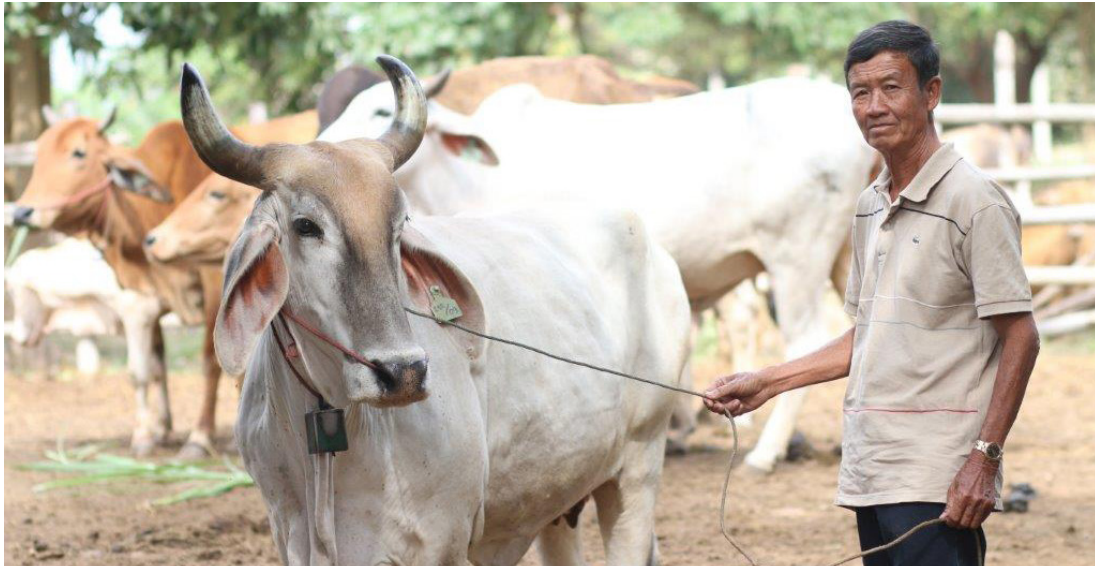
ທ່ານ ສຸວັດ ເກດສັດທາ ໄດ້ຮຽນຮູ້ເຕັກນິກການລ້ຽງສັດແບບທັນສະໄໝພາຍໃຕ້ໂຄງການສົ່ງເສີມການຜະລິດກະສິກຳເພື່ອເປັນສິນຄ້າທີ່ ເອດີບີ ໃຫ້ການສະໜັບສະໜູນ.

ເພື່ອຊ່ວຍລັດຖະບານໃນການຮັບມືກັບບັນຫາທ້າທາຍເຫຼົ່ານີ້ ແລະ ເພື່ອບັນລຸຕາມເປົ້າໝາຍການຂະຫຍາຍຕົວຂອງແຜນ ພັດທະນາເສດຖະກິດ-ສັງຄົມແຫ່ງຊາດຄັ້ງທີ VIII, ພາຍໃຕ້ຍຸດທະສາດການຮ່ວມມືກັບປະເທດ 2017-2020, ເອດີບີ ຈະສຸມໃສ່ 3 ຂົງເຂດຍຸດທະສາດ ຄື: ການພັດທະນາໂຄງລ່າງພື້ນຖານ ແລະ ພາກເອກະຊົນ ຊຶ່ງຈະຊ່ວຍສົ່ງເສີມການຈ້າງງານ ແລະ ສ້າງລາຍຮັບ, ການພັດທະນາຊັບພະຍາກອນມະນຸດ, ແລະ ການຄຸ້ມຄອງຊັບພະຍາກອນທຳມະຊາດແບບຍືນຍົງ ແລະ ການສ້າງເງື່ອນໄຂໃນການປັບໂຕຕໍ່ກັບການປ່ຽນແປງຂອງສະພາບດິນຟ້າອາກາດ ໂດຍມີ ຄວາມສະເໝີພາບບົດບາດຍິ່ງ-ຊາຍ ແລະ ການປົກຄອງບໍລິຫານ ຊຶ່ງເປັນບັນຫາທີ່ຕ້ອງເອົາໃຈໃສ່ໃນທຸກຂົງເຂດແລະຂະແໜງການ.